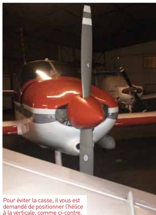
Pour éviter la casse, il vous est demandé de positionner l'hélice à la verticale, comme ci-contre.