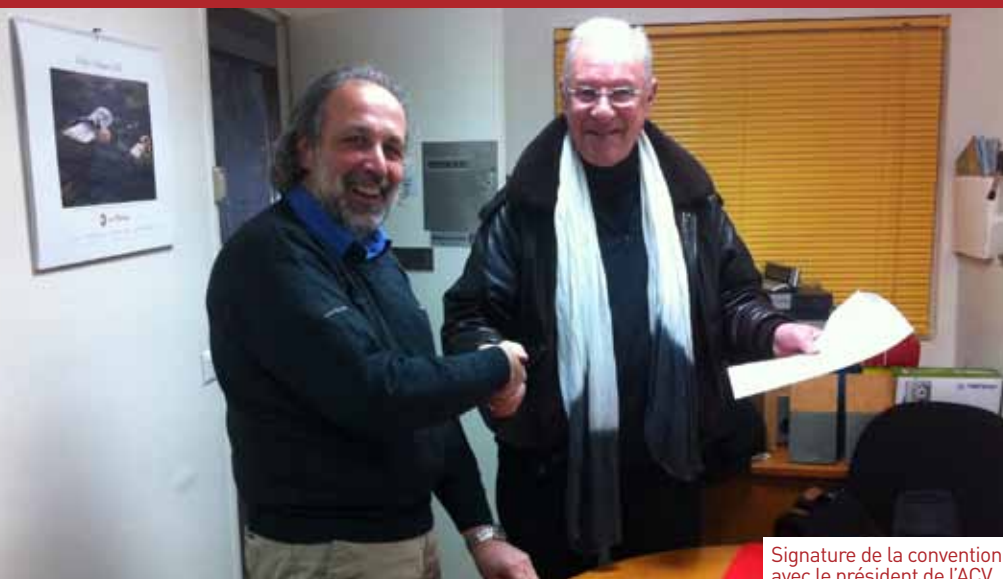
Signature de la convention avec le président de l'ACV